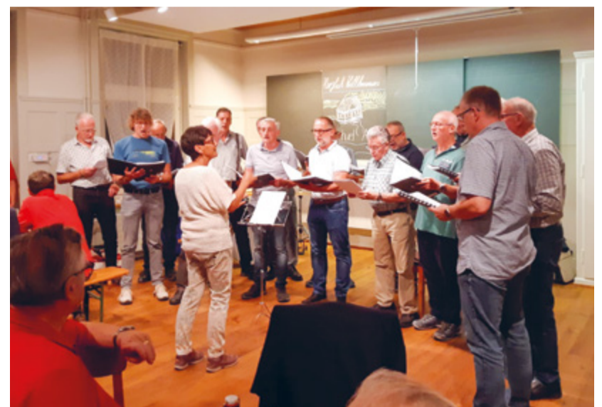
Männerchor Egg-Oberwangen, Au, 21.08.2025